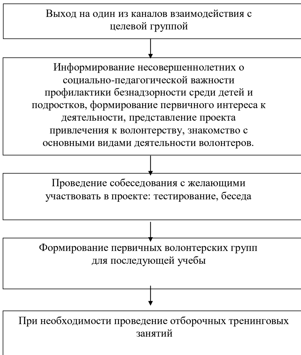
Рис. 2. Привлечение подростков к волонтерской деятельности

II этап - подготовка несовершеннолетних волонтеров к профилактической деятельности среди сверстников.